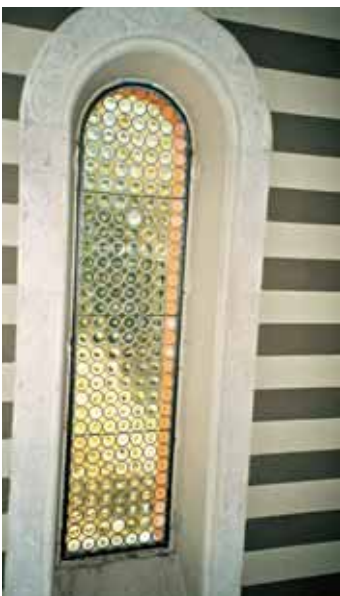
Fano, chiesa di Villa S. Biagio. Monofora vetrata dopo il restauro