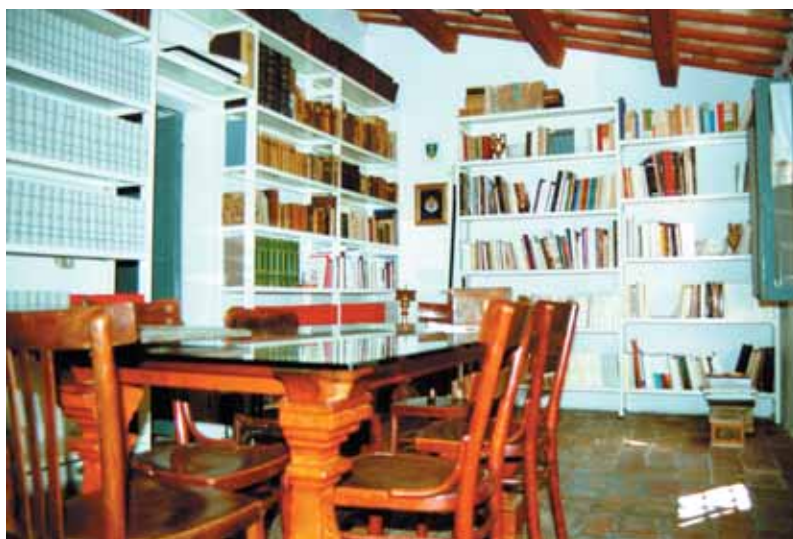
Fano, interno della Biblioteca della Confraternita di S. Maria del Suffragio

Bibliografia: Federico Vargas, Chiesa e Confraternita del Suffragio in Fano , Fano, Scuola Tipografica Fanese, 1913; Massimo Bonifazi, Studio ed analisi del privilegio della liberazione di un condannato a morte concesso alla Confraternita del Suffragio di Fano , in 'Nuovi Studi Fanesi' vol.16 (2002); Idem, Un documento inedito dell'archivio della Confraternita del Suffragio in Fano , in 'Studia Picena' vol. anno 2003; Idem, I priori della confraternita di Santa Maria del Suffragio di Fano , in 'Nuovi Studi Fanesi' vol.17 (2003).