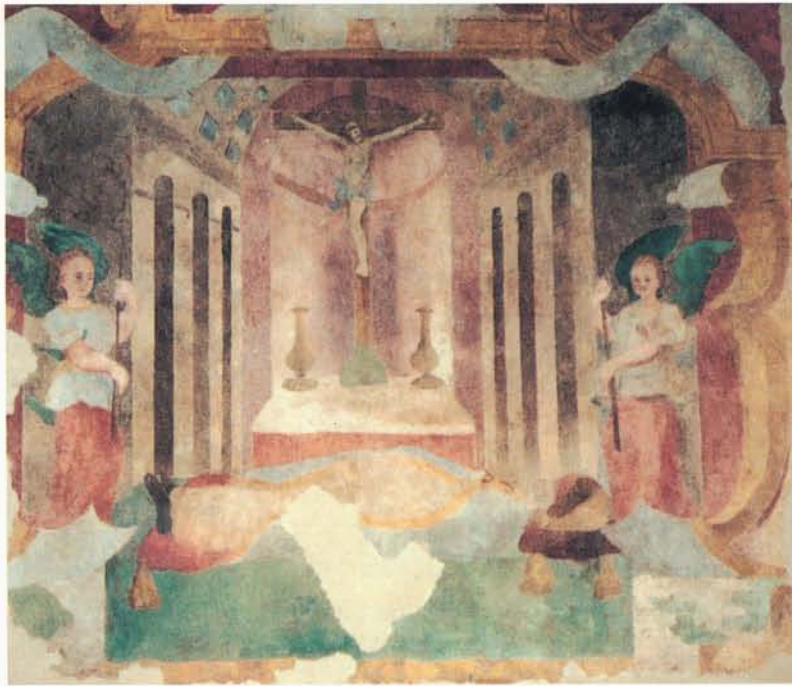
Immagine, dopo il restauro, della pittura murale scoperta all' interno del Tempietto di S. Paterniano.