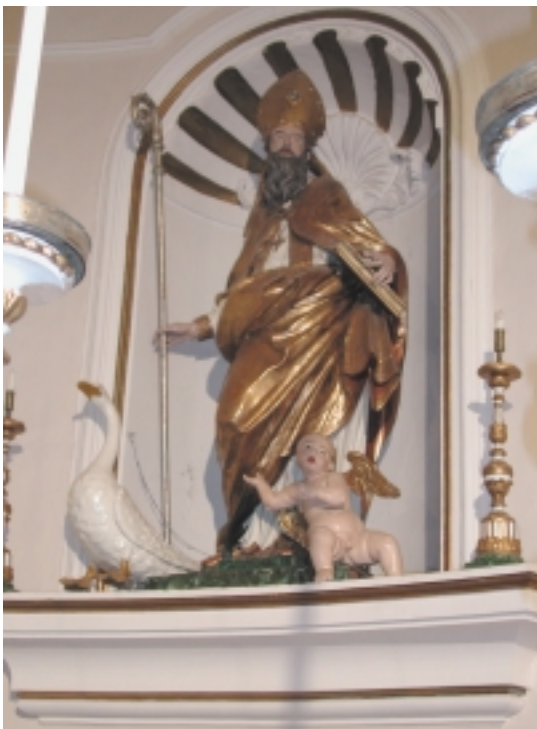
Facciata della piccola chiesa di S. Geronzio a Cagliari. Il primo nucleo della costruzione fu un oratorio, sorto in un campo ventoso, sul luogo del martirio del Santo. Quando nel 1725 la Comunità cagliese si accollò le spese per la sua ricostruzione, l'edificio prese l'aspetto attuale. Statua dorata del patrono di Cagliari S. Geronzio, posta all'interno della chiesa dedicata al Santo.