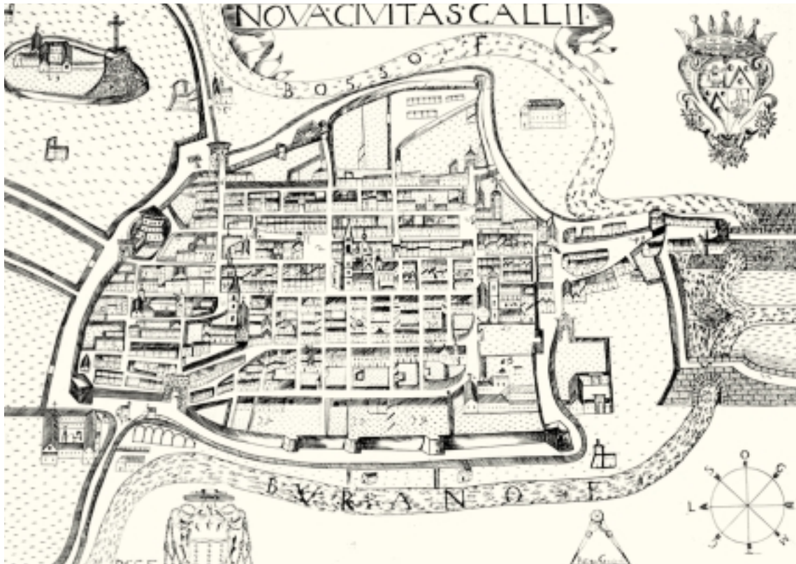
Antica pianta della “Nova Civitas Callii” (Cagli) risalente al 1670.