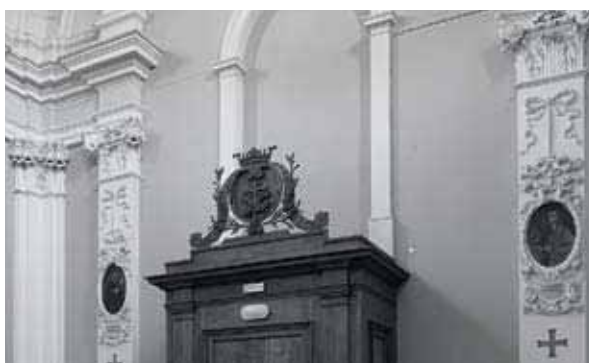
Controfacciata della Chiesa di Santa Maria Nuova, dove era la cantoria