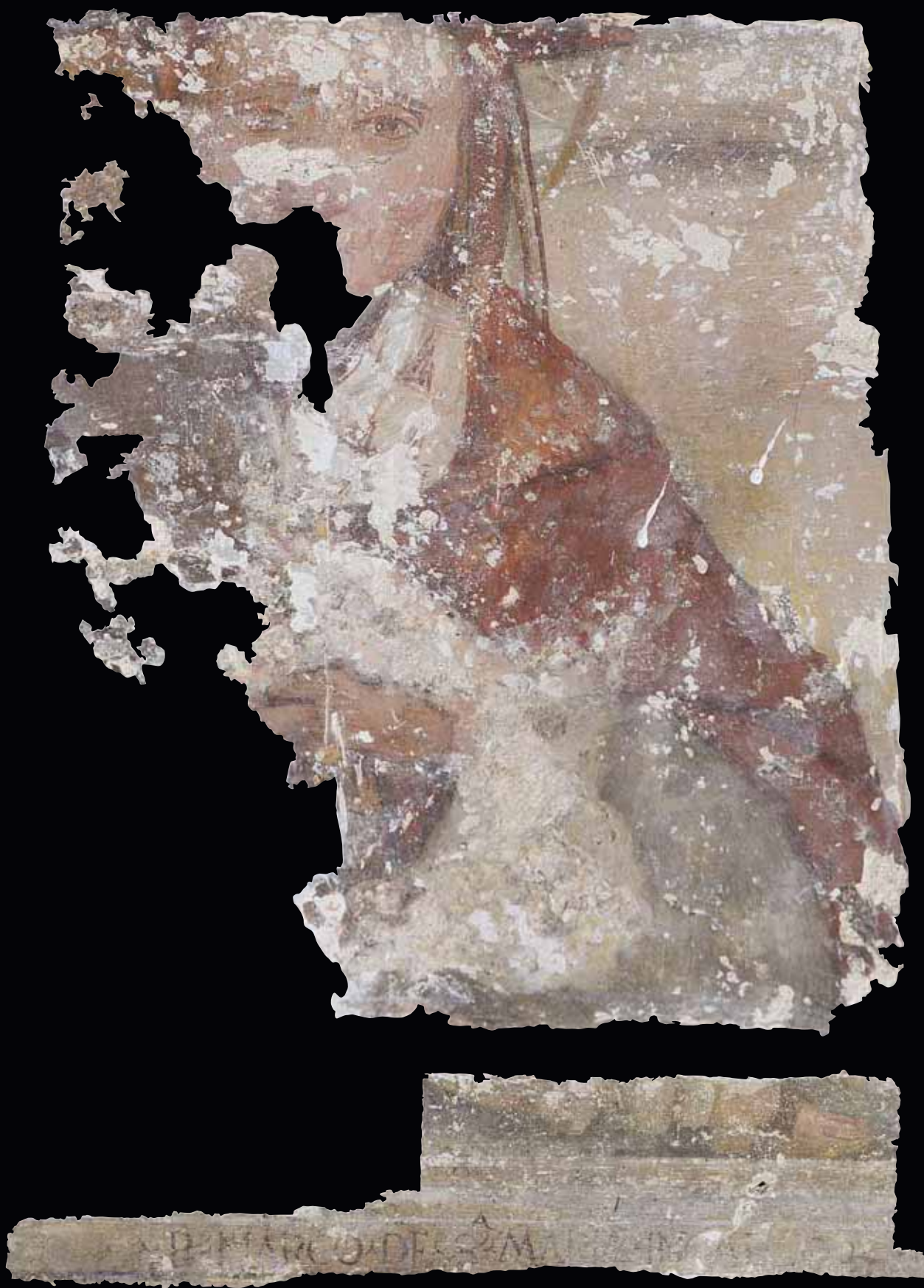
Lunetta n° 6: iscrizione