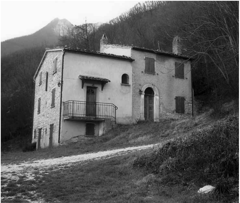
Rave di Venatura. Casa natale di Bartolo.