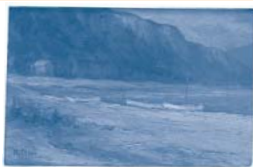
"Marina" di Nino Cespi

Uno tra gli ultimi quadri moderni acquistati dalla Fondazione