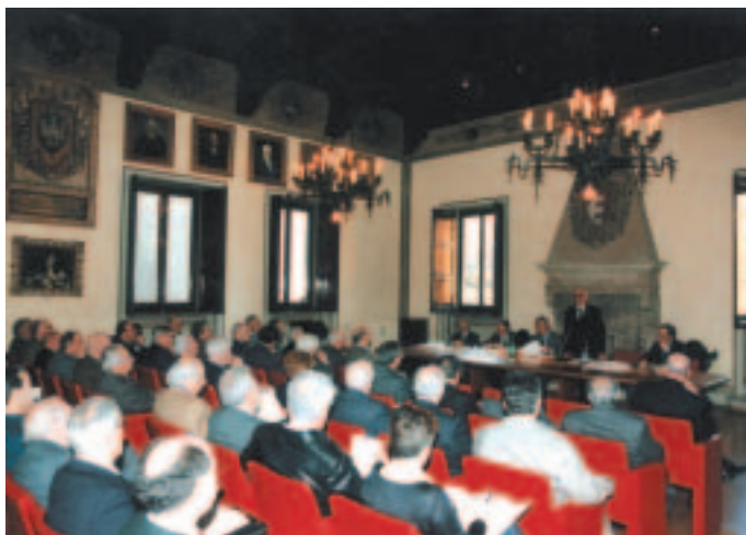
La sala della riunione durante l'intervento del Presidente dell'ACRI, avv. Giuseppe Guzzetti

Il Presidente Guzzetti ha infine anticipato un'iniziativa ACRI aperta a tutte le Fondazioni per impugnare in sede giudiziaria la Circolare del Ministero dell'Economia e delle Finanze che limita fortemente, in questo periodo transitorio, l'attività erogativa delle Fondazioni (interventi non superiori a 25.000 euro) con forte riduzione degli apporti finanziari a favore della collettività locale e della società civile.