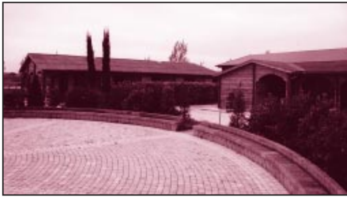
Centro socio-educativo "ITACA" - ANFFAS di Fano, loc. Madonna Ponte

La variazione dell'asset avvenuta all'inizio di ottobre 1999 ha consentito di sfruttare l'andamento favorevole dei mercati ed ha prodotto un notevole recupero in termini di rendimento, fino a realizzare