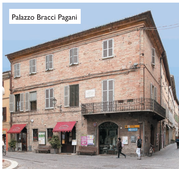
Palazzo Bracci Pagani

L'acquisto recente dello storico Palazzo Bracci Pagani consentirà di realizzare un museo di arte contemporanea, una sala espositiva sempre di arte contemporanea, una biblioteca specialistica in storia della ceramica (donazione Bojani), la sistemazione del circolo numismatico Castellani con un sito espositivo e una sala dedicata al celebre attore Ruggero Ruggeri nato nel palazzo oltre 100 anni fa. Quanto agli eventi in questo settore spicca il progetto per una mostra in occasione del 400° anniversario della nascita del pittore pesarese Simone Cantarini che la Fondazione ha in animo di organizzare in sinergia con il Comune di