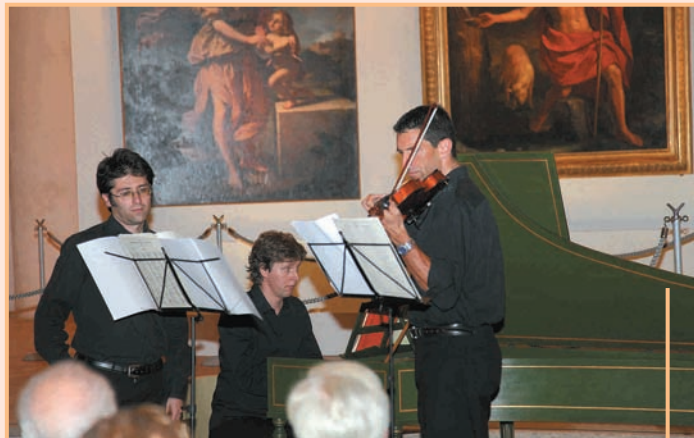
Concerto di musica da camera dell'Orchestra Sinfonica "G. Rossini" (trio)