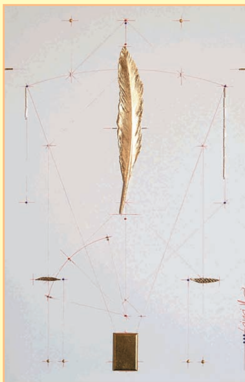
Una delle due opere donate dall'autore Antonio Bellantuno "Il pensiero nell'arte" matita e lamina d'oro su acrilico